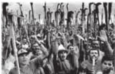
SALGADO, S. Terra. São Paulo: Companhia das Letras, 1997.

O livro Terra, do fotógrafo Sebastião Salgado, documenta o drama dos despossuídos e migrantes no Brasil, ao longo da história, sendo dedicado a milhares de famílias no país.